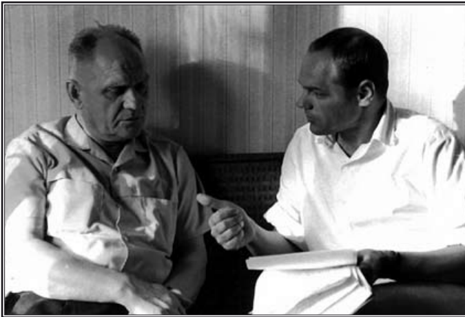
Сейчас я очень жалею, что мало беседовал с отцом. Мне его сильно не хватает, он был очень хорошим человеком

В 1946 году отца направили в Комсомольск-на-Амуре, нашу теплушку вновь поставили на рельсы, и мы добирались до места в течение 16 суток.